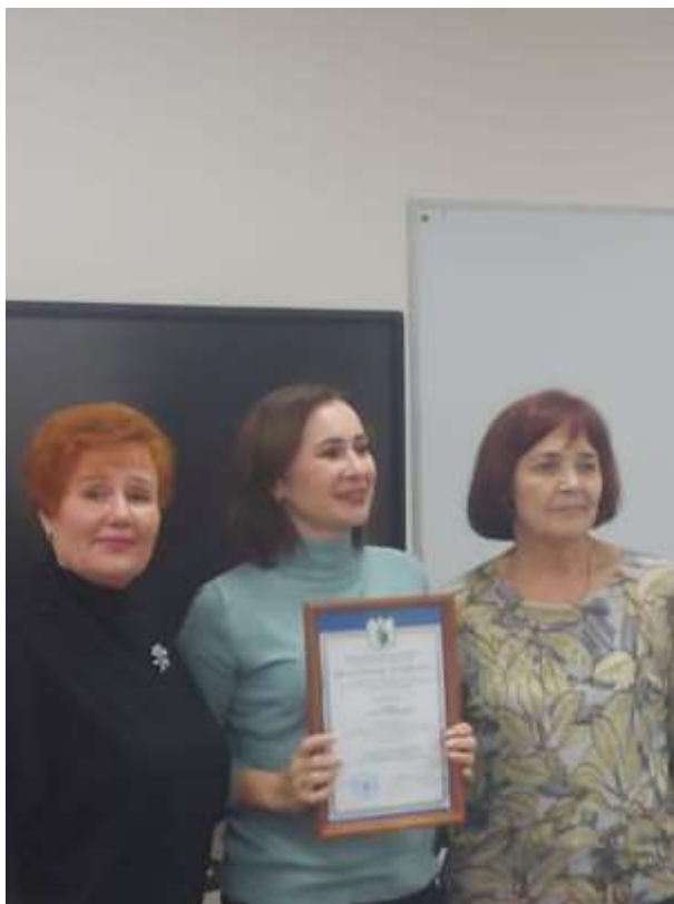
СЕМИНАР В БОРОВСКЕ

Состоялись выездные совещания «О выполнении коллективных договоров в образовательных организациях» Боровского, Перемышльского и Хвастовичского районов.