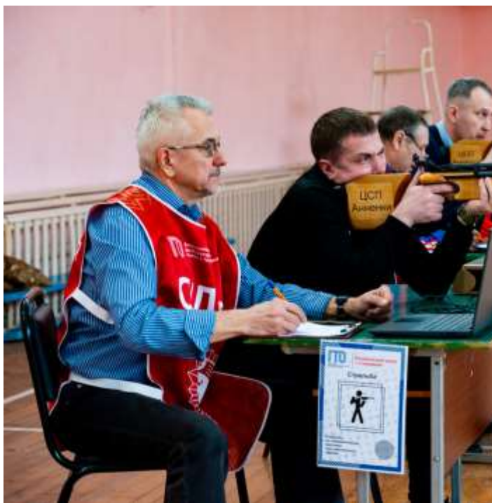
СОРЕВНОВАНИЯ ПО СТРЕЛЬБЕ

В КФ МГТУ им. Н. Э. Баумана прошла спартакиада преподавателей. В соревнованиях по футболу, волейболу, стрельбе, настольному теннису и шахматам приняли участие более ста человек. Участники продемонстрировали волевые качества и спортивные достижения.