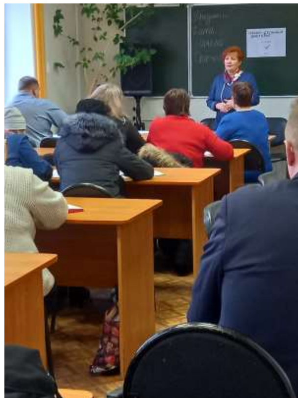
СЕМИНАР В ХВАСТОВИЧАХ